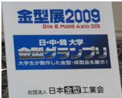
金型グランプリのサイン

関連サイト http://www.itp.gr.jp/im/gramprix.html