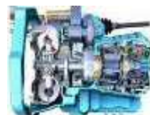
トランスミッション (A/T M/T CVT HV)