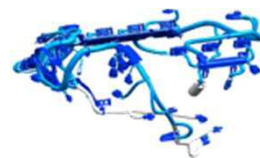
ワイヤーハーネス

どちらも車の運動性能に直結した基幹部品です。工学系の知識を活かせるのはもちろんのこと、『車が好き』『モノづくりが好き』という方には非常にやりがいを感じられる仕事です。