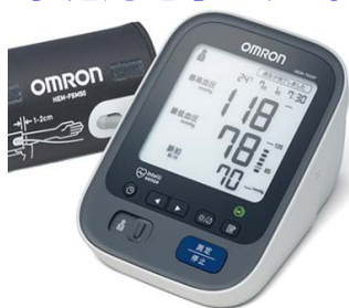
家庭用電子血圧計