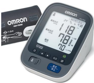
家庭用電子血圧計