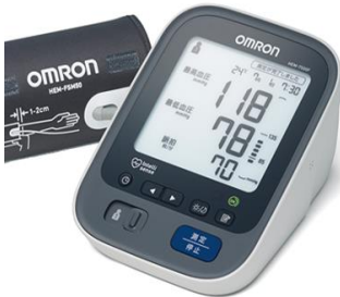
家庭用電子血圧計