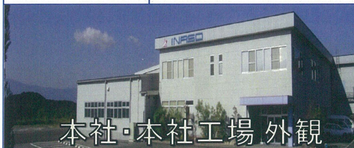
本社・本社工場 外観