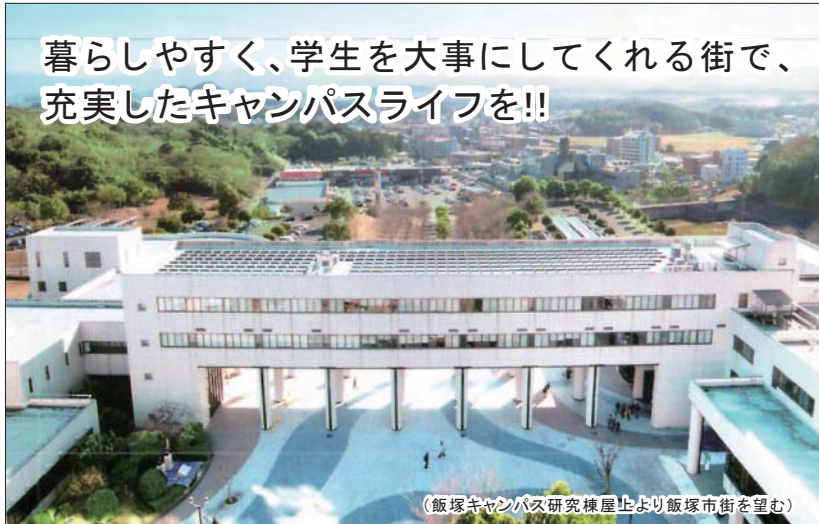
(飯塚キャンパス研究棟屋上より飯塚市街を望む)