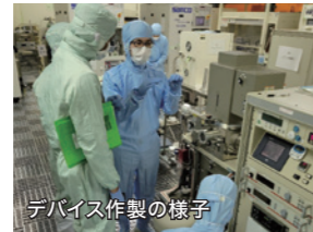
デバイス作製の様子

人工知能を利用したデータの分析・分類や回帰・予測する技術が急速に進展していますが、現在のハードウェアは情報処理に大きな電力を消費しています。私たちは電子のもつスピンという機能をうまく活かして、省電力人工知能デバイス技術の創出を目指しています。